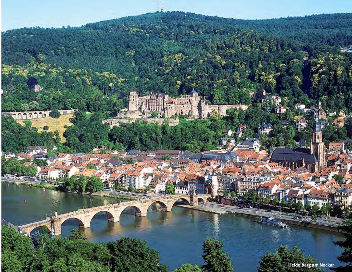
Heidelberg am Neckar